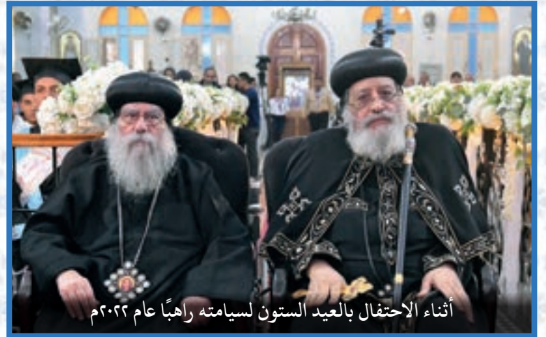
أثناء الاحتفال بالعيد الستون لسيامته راهبًا عام ٢٠٢٢م