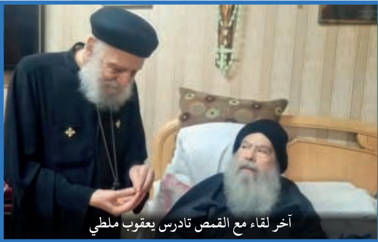
آخر لقاء مع القمص تادرس يعقوب ملطي