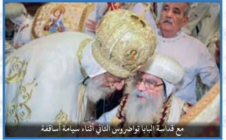
مع قداسة البابا تواضروس الثاني أثناء سيامة أساقفة