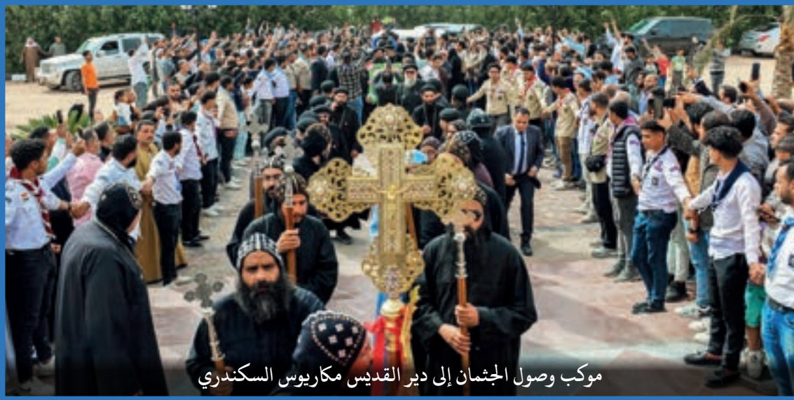
موكب وصول الجثمان إلى دير القديس مكاريوس السكندري