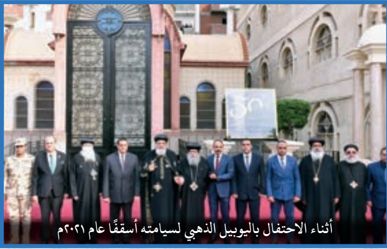
أثناء الاحتفال باليوبيل الذهبي لسيامته أسقفًا عام ٢٠٢١م